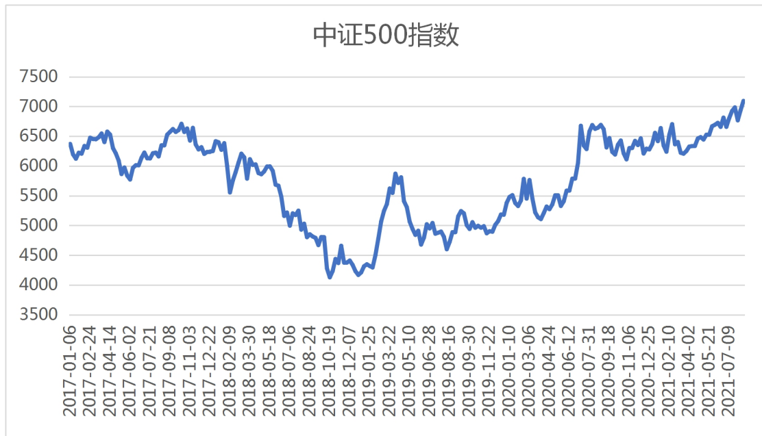
图 3-中证 500 指数市场表现